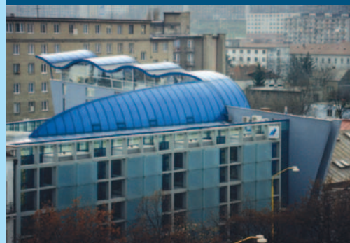
Regionálna pobočka Tatra Banky v Košiciach