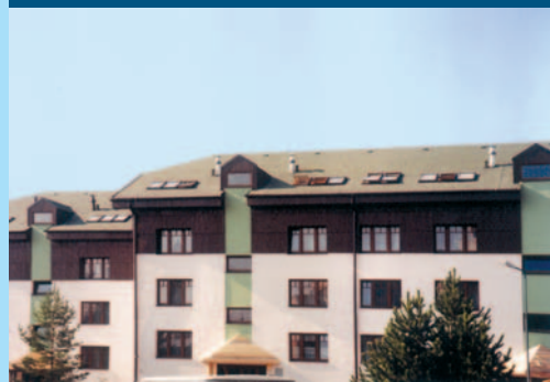
Nadstavba bytového domu v Dolnom Smokovci