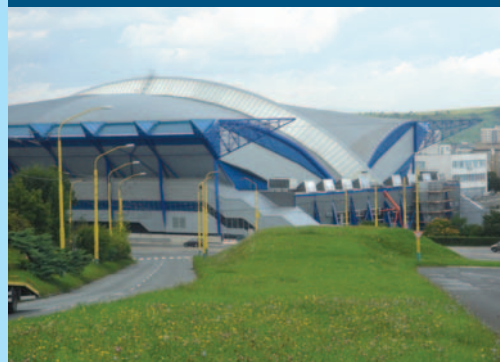
Zimný štadión HC Košice – Steel aréna