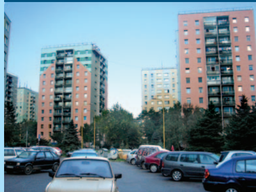
Zateplené bytové domy