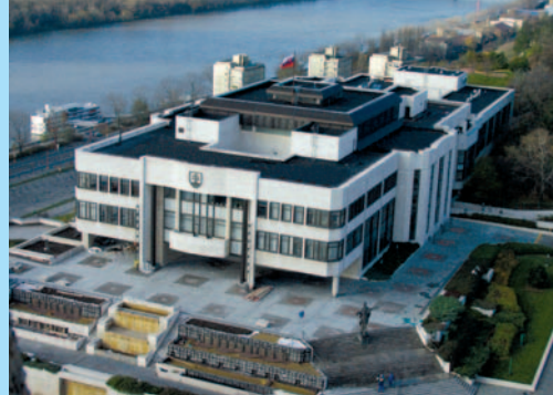
Budova Národnej rady SR